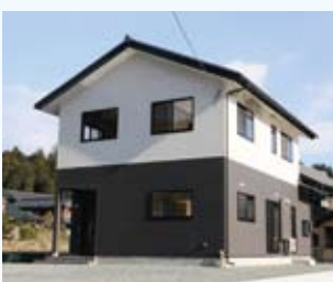
2016(平成28年) 若狭町 田邊邸