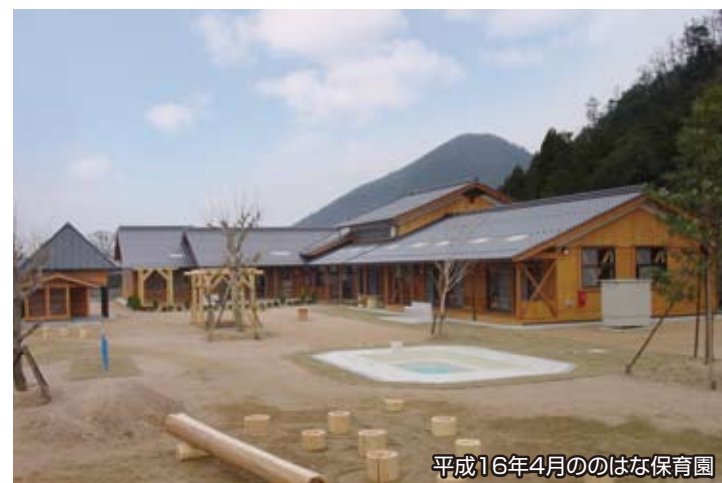
平成16年4月ののはな保育園