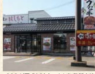
2004(平成16年) すき家 敦賀木崎