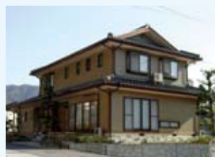
2001(平成13年) 名田庄 早川邸