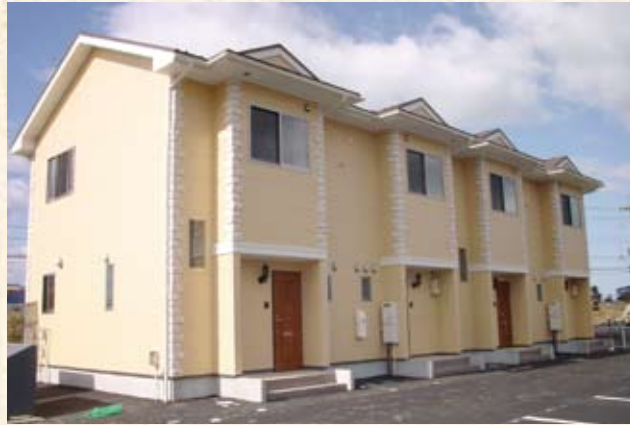
2006(平成18年) リバーサイドレジデンス