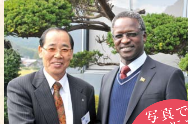
2012(平成24年) ケニア特命全権大使来社