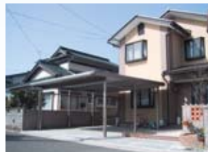
2004(平成16年) 敦賀市 増田邸