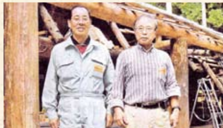
2007(平成19年) NPO法人 里豊夢わかさ10周年(副理事)