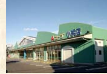
2001(平成13年) Aコープ小浜