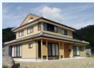
2003(平成15年) 若狭町 西野邸