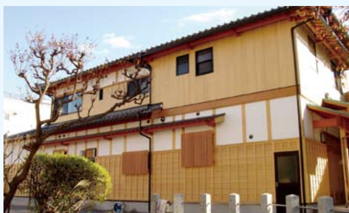
2005(平成17年) 敦賀市 善妙寺庫裡