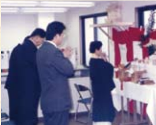
1997(平成9年) 福井営業所開設