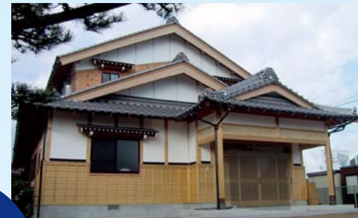
2002(平成14年) 敦賀市 長谷邸