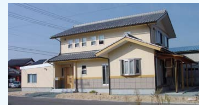
2006(平成18年) 敦賀市 寺谷邸