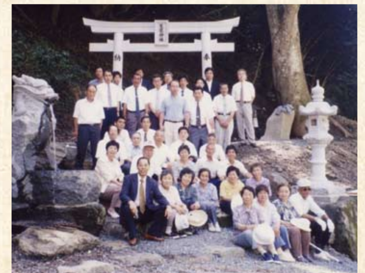
2003(平成15年) 新道 天竜神社例祭鳥居水汲み場灯籠石工事完成式