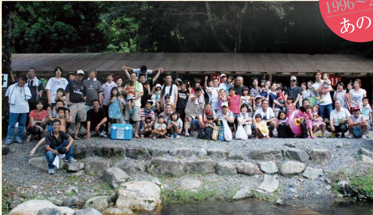
2010(平成22年) 親和会バーベキュー