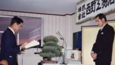
創立20周年記念祝宴会 永年勤続者表彰