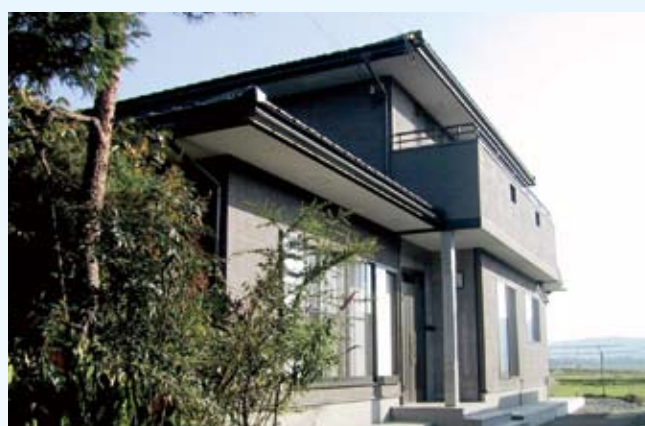
2001(平成13年) 若狭町 中川邸