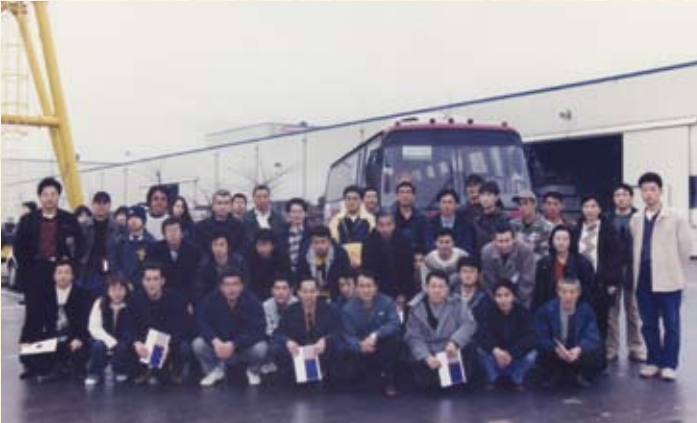
1998(平成10年) 社員研修旅行 韓国 ミラトン工場見学