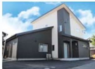
2010(平成22年) 敦賀市 中島邸