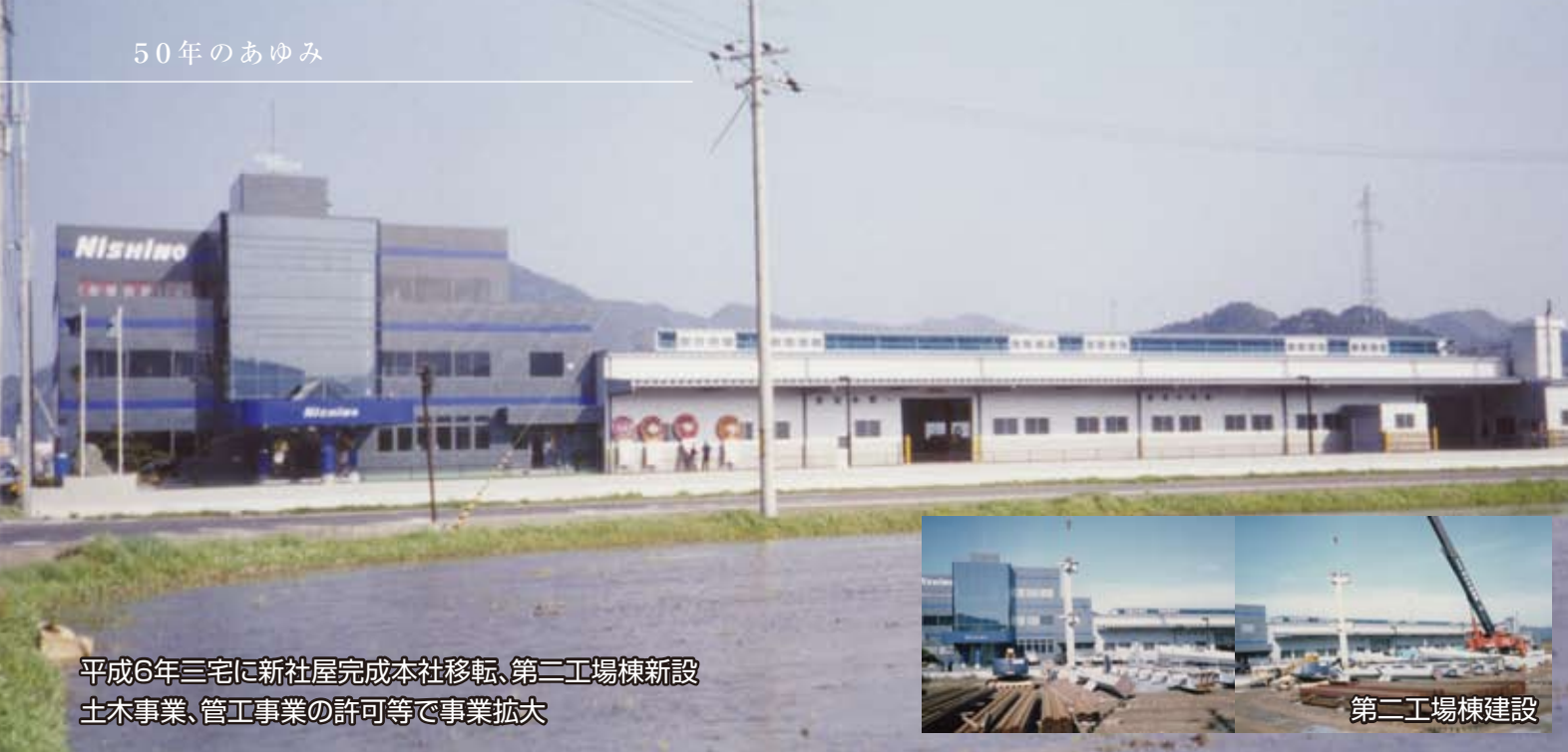
平成6年三宅に新社屋完成本社移転、第二工場棟新設 土木事業、管工事業の許可等で事業拡大