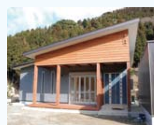
2008(平成20年) 若狭町 西野邸