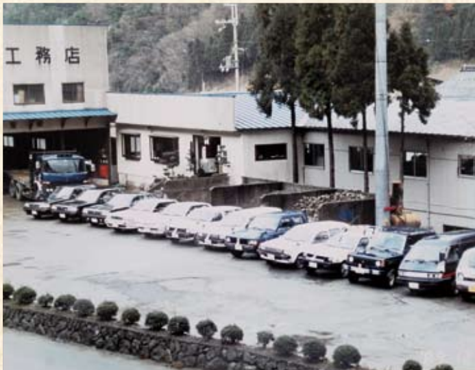
1989(平成元年) 新道 旧本社