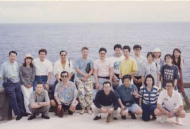
1996(平成8年) 北マリアナ諸島 サイパン