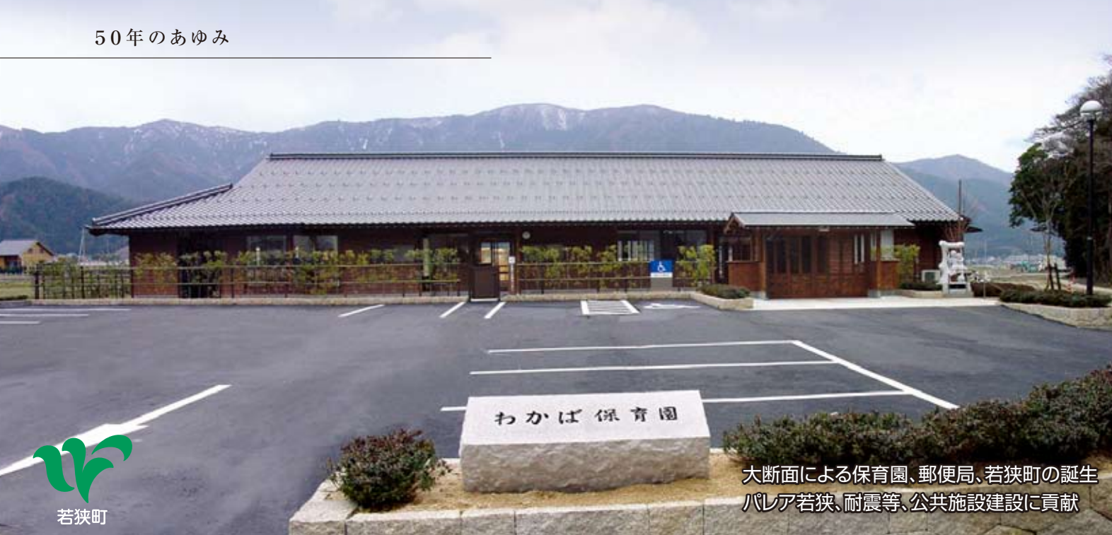
大断面による保育園、郵便局、若狭町の誕生 バリア若狭、耐震等、公共施設建設に貢献