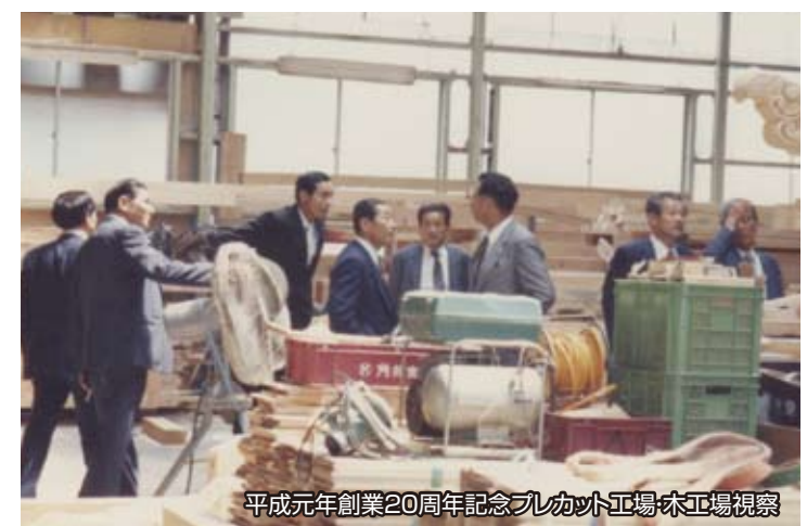
平成元年創業20周年記念プレカット工場・木工場視察