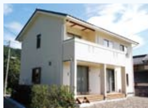
2008(平成20年) 若狭町 堀田邸