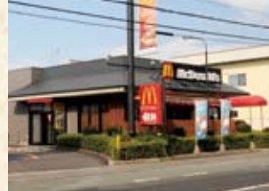
2001(平成13年) マクドナルド小浜店