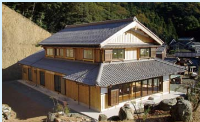
2003(平成15年) 小浜市 岡邸