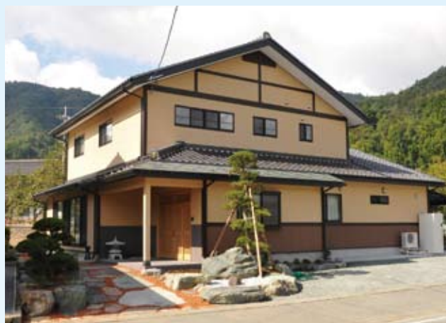
2011(平成23年) 若狭町 小林邸