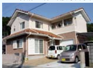
2005(平成17年) 敦賀市 田村邸