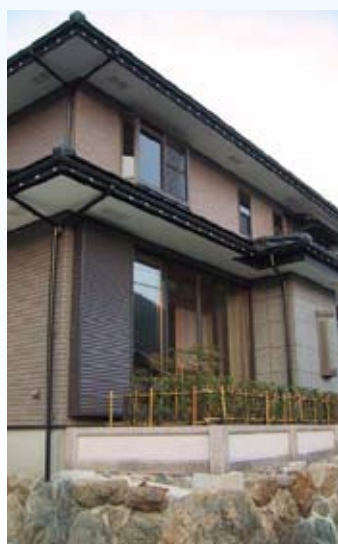
2003(平成15年) 若狭町 西野邸