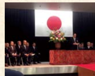
国土交通大臣表彰式