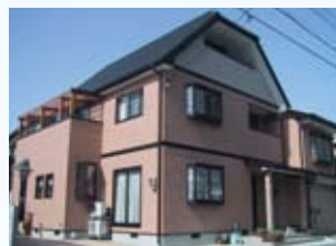
2004(平成16年) 敦賀市 飯田邸