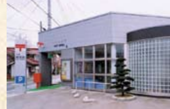
1996(平成8年) 十村郵便局