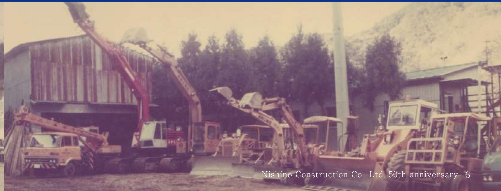
Nishino Construction Co., Ltd. 50th anniversary 6