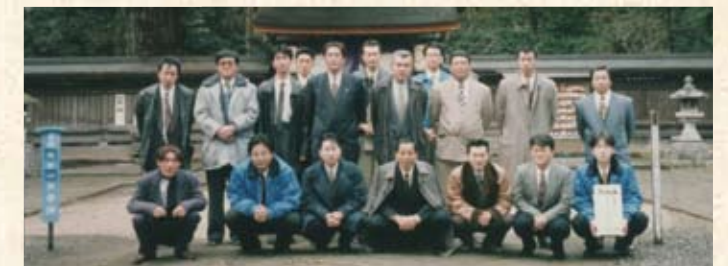
1997(平成9年) 姫神社 初詣