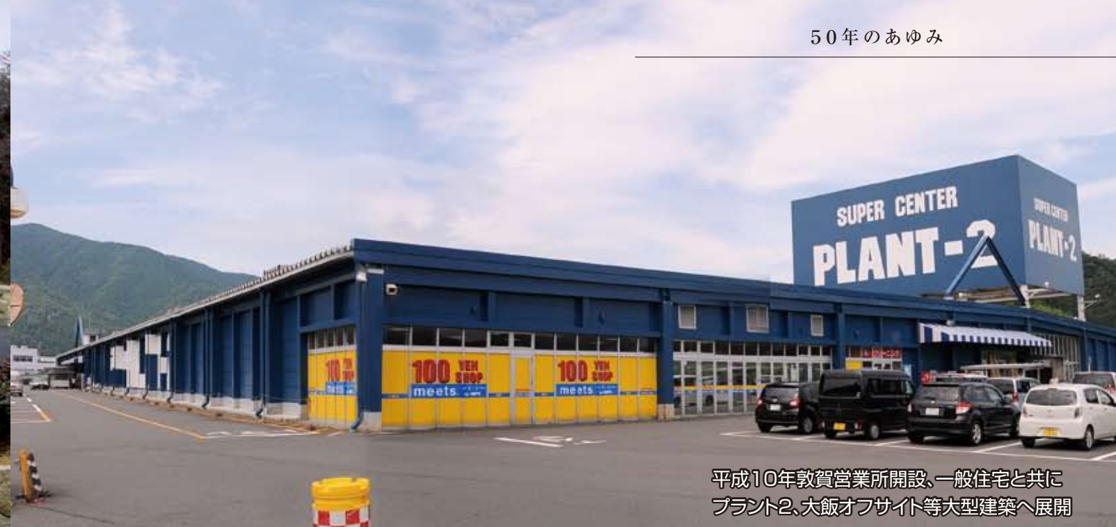
平成10年敦賀営業所開設、一般住宅と共に プラント2、大飯オフサイト等大型建築へ展開