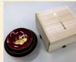
国土交通大臣表彰記念品