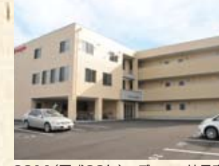
2011(平成23年) デンヨー社員寮