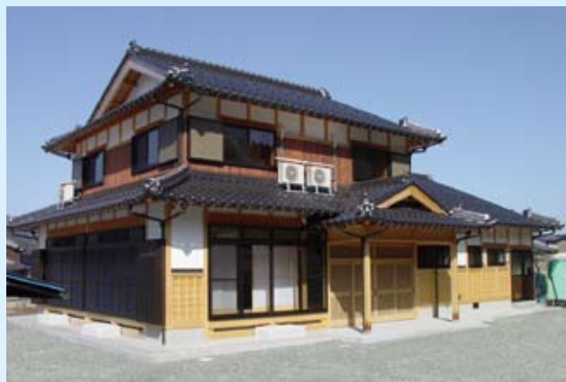
2004(平成16年) おおい町 桑田邸