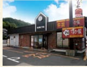
2005(平成17年) すき家小浜店