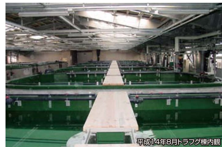
平成14年8月トラフグ棟内観