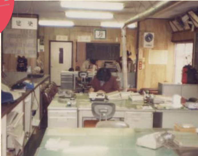
1975(昭和50年) 新道事務所