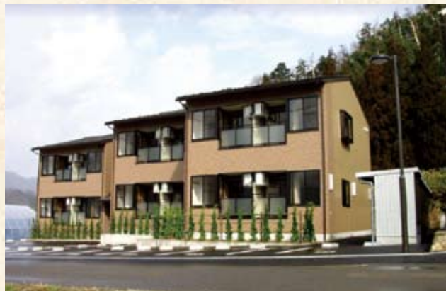
2004(平成16年) ネオパレス若狭