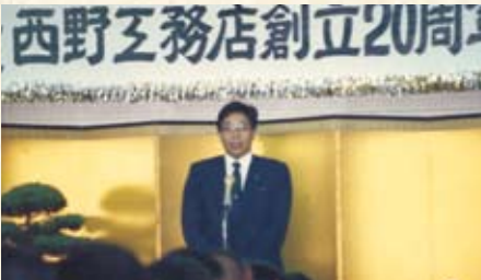
創立20周年記念祝宴会 会長挨拶