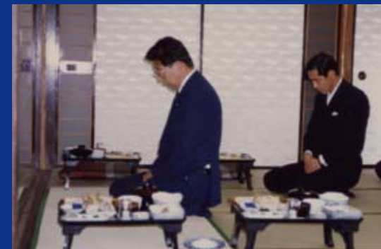
平成元年創業20周年記念・祝宴会場