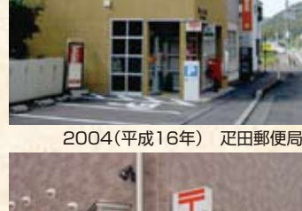
2004(平成16年) 敦賀河内簡易郵便局