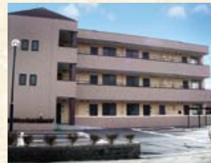
2003(平成15年) ルミナスハイツ