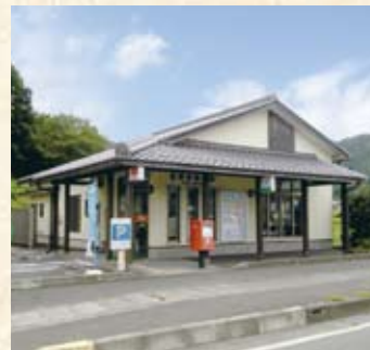
2004(平成16年) 安賀里郵便局