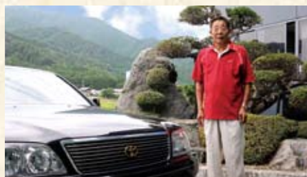
2014(平成26年) 会長 愛車マジスタと共に