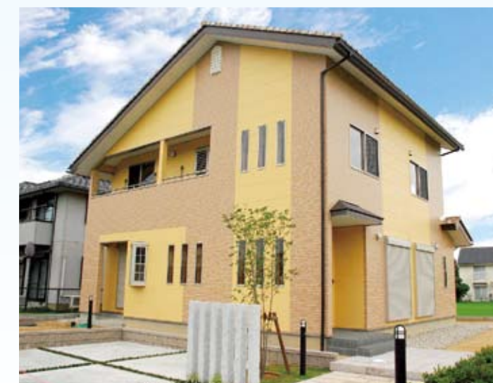
2008(平成20年) 敦賀市 酒谷邸