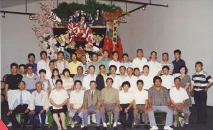
1992(平成4年) 岩手県 岩鑄鉄器館