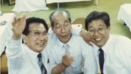
創立20周年記念祝宴会 会長満面の笑みで