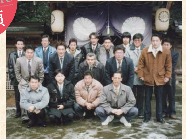
1996(平成8年) 姫神社 初詣