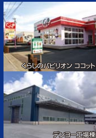
くらしのパビリオン ココット