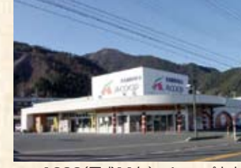
1999(平成11年) Aコープ上中