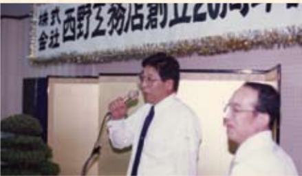
1989(平成元年) 創立20周年記念祝宴会