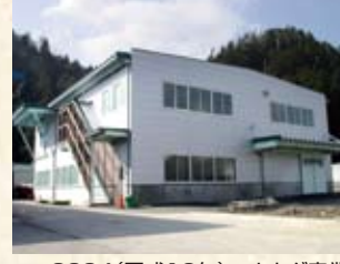
2004(平成16年) ナカダ産業