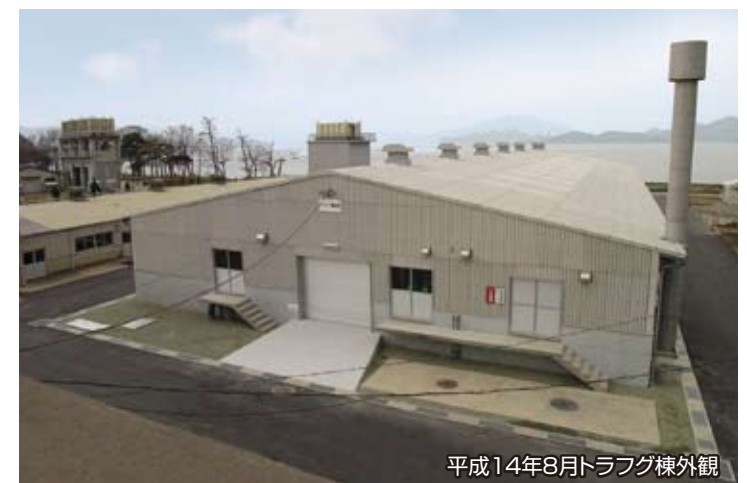
平成14年8月トラフグ棟外観