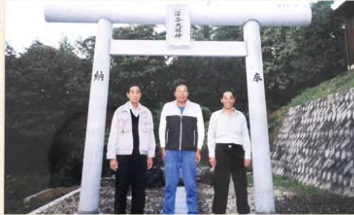
2001(平成13年) 深谷大明神奉納