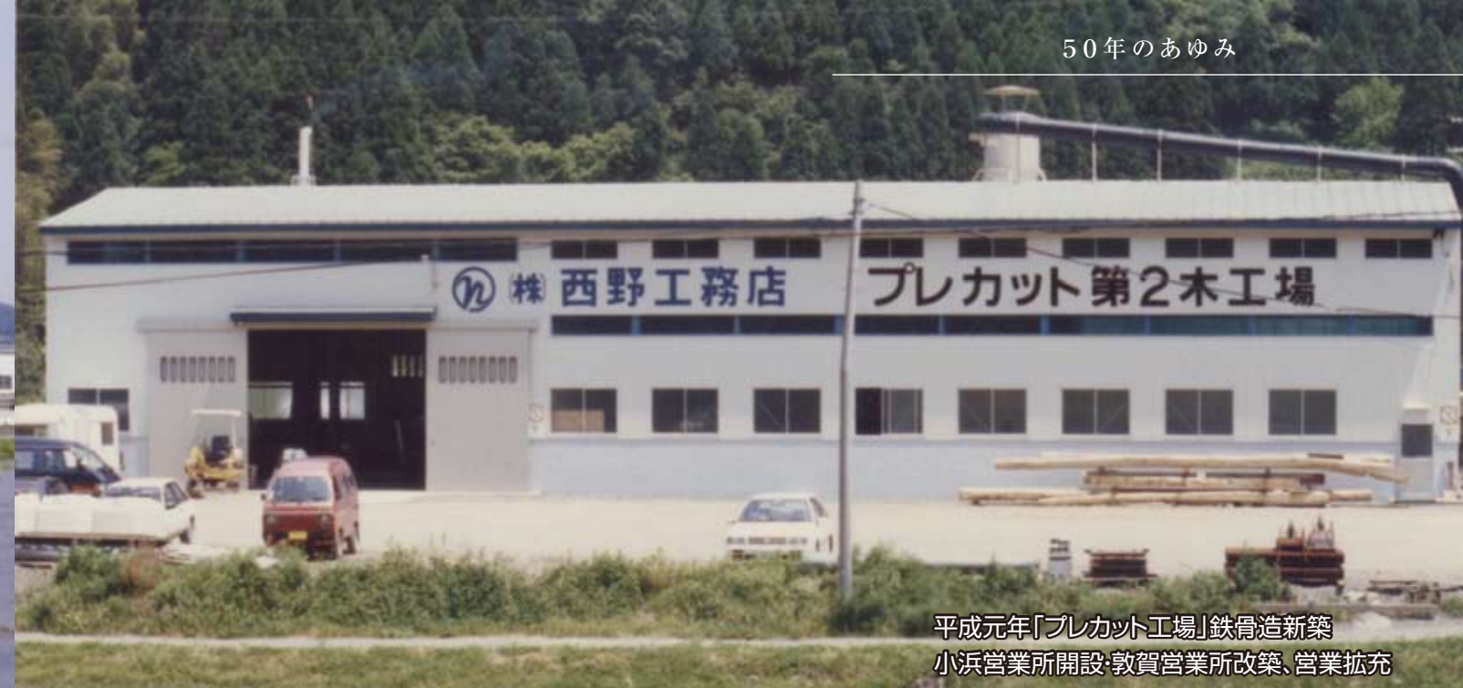
平成元年「プレカット工場」鉄骨造新築 小浜営業所開設・敦賀営業所改築、営業拡充