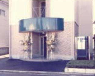
1997(平成9年) 福井営業所開設