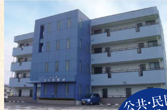
2001(平成13年) ハイツユリカメ