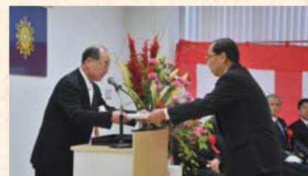
2012(平成24年) 若狭町消防署上中分署竣工式