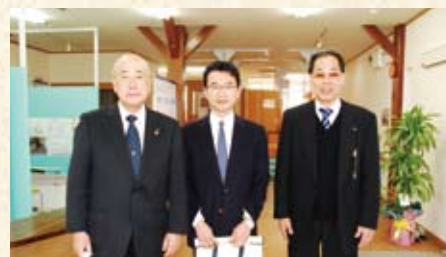
2009(平成21年) 社会福祉協議会贈呈式・ココット