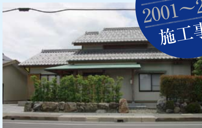
2001(平成13年) 小浜まち景観賞建造物部門受賞 矢袋邸