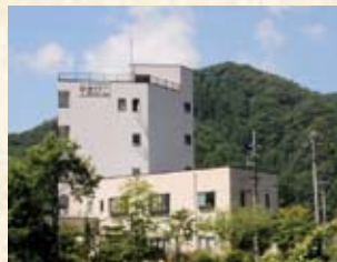
1997(平成9年) リフレッシュまびこ