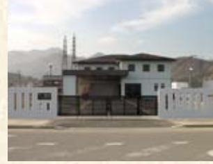
2004(平成16年) ワコー電器