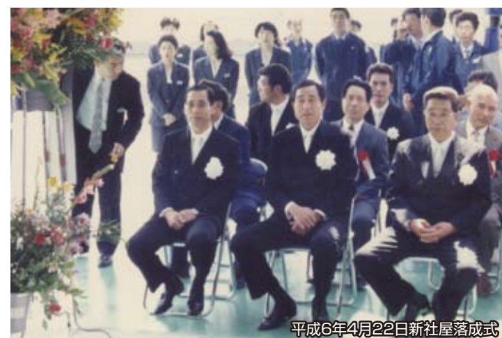
平成6年4月22日新社屋落成式