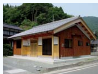
2005(平成17年) 名田庄 池田邸