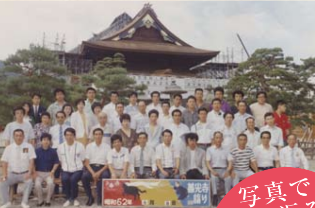
1987(昭和62年) 長野県 善光寺詣り