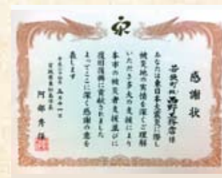
2012(平成24年) 東日本大震災復興支援 感謝状