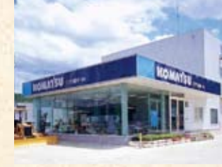
2003(平成15年) コマツ福井・小浜