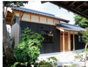
2009(平成21年) 若狭町 池上邸