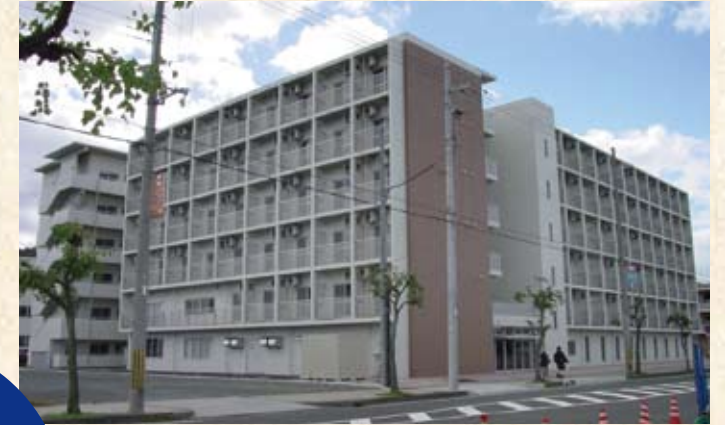
2004(平成16年) 小浜病院 看護師学生寮