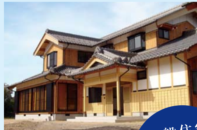
2001(平成13年) 敦賀市 中川邸