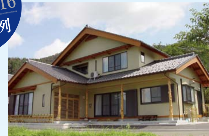
2003(平成15年) 若狭町 竹原邸