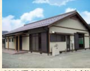
2001(平成13年) あさぎり木会館