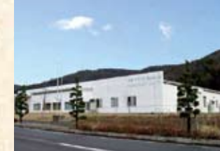
1996(平成8年) 大阪プラント