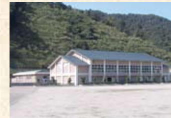
1997(平成9年) 嶺南養護学校体育館