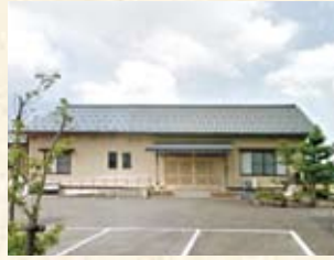
2004(平成16年) 武生小野町公民館