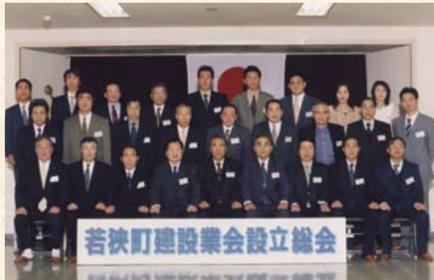
2005(平成17年) 若狭町建設業会設立記念