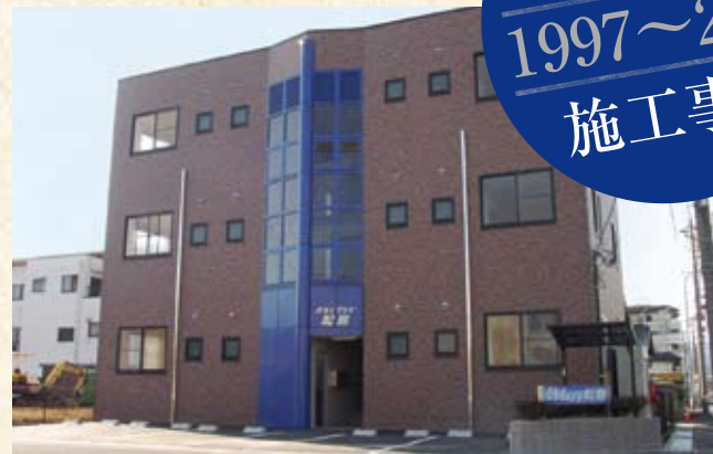
2003(平成15年) スカイプラザ松島