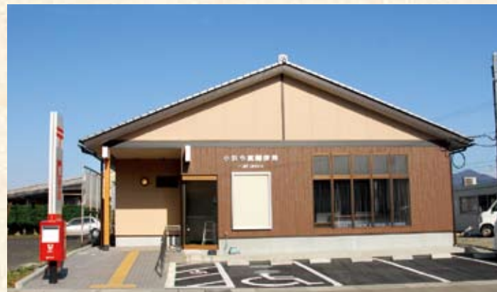
2007(平成19年) 今富郵便局