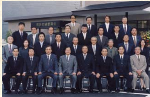
2005(平成17年) 若狭町建築業会会館竣工記念