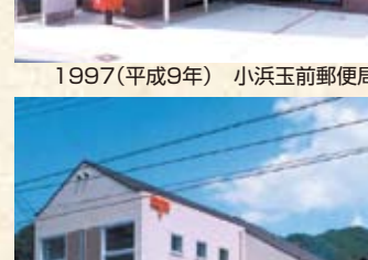
1996(平成8年) 小浜西津郵便局