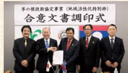
2016(平成28年) 若狭町草の根技術協定事業調印式