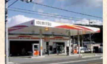
1997(平成9年) 出光給油所