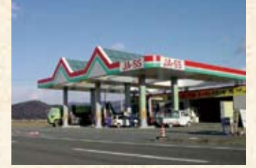
1997(平成9年) JA若狭オートピアわかさ