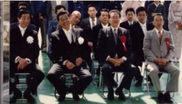
1994(平成6年) 新社屋 竣工式典