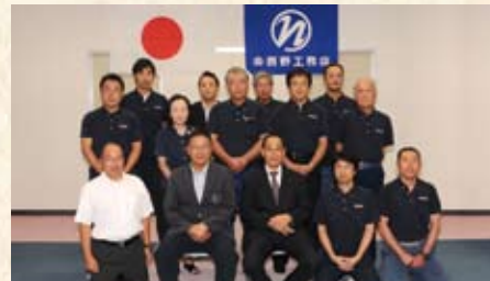
2014(平成26年) 永年勤続表彰