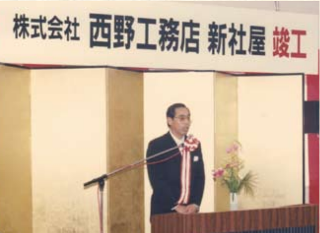
1994(平成6年) 新社屋 竣工式典