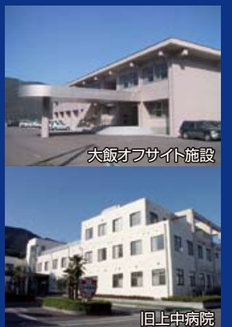
大飯オフサイト施設