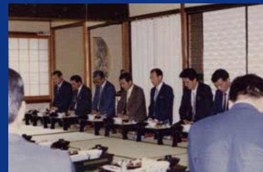
平成元年創業20周年記念・祝宴会場