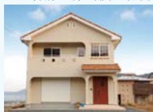
2009(平成21年) 若狭町 西岡邸