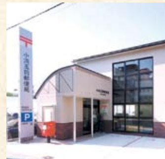
1997(平成9年) 小浜玉前郵便局