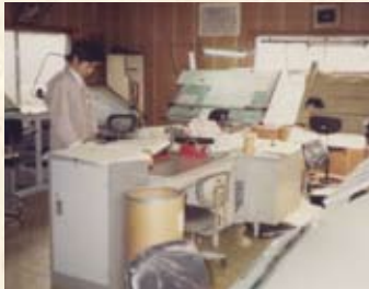
1975(昭和50年) 新道事務所