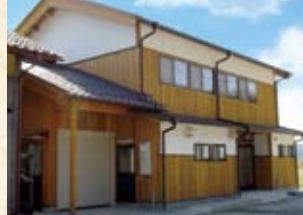
2002(平成14年) 下野木会館