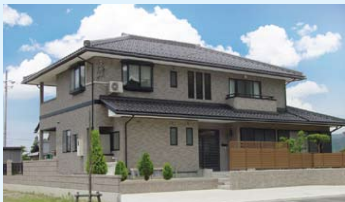
2003(平成15年) 小浜市 井上邸