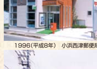
1996(平成8年) 十村郵便局