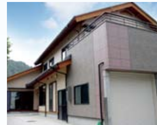
2004(平成16年) 名田庄 田中邸