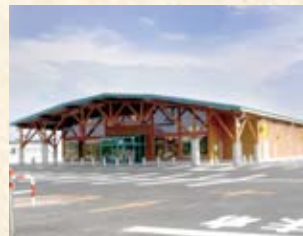
2004(平成16年) ダイナム滋賀高山店