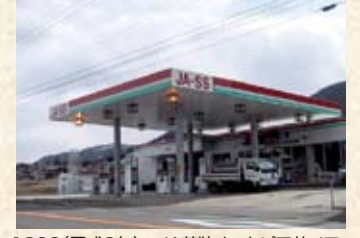
1996(平成8年) JA若狭オートピア井ノ口