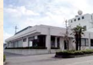
1999(平成11年) やすらぎセンター