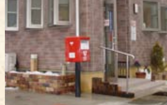
2004(平成16年) 敦賀河内簡易郵便局