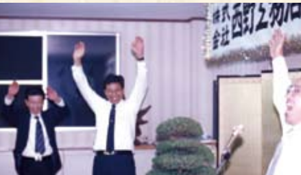
創立20周年記念祝宴会 万歳三唱