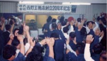
創立20周年記念祝宴会 万歳三唱