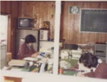
1975(昭和50年) 新道事務所