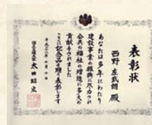
2014(平成26年) 国土交通大臣表彰