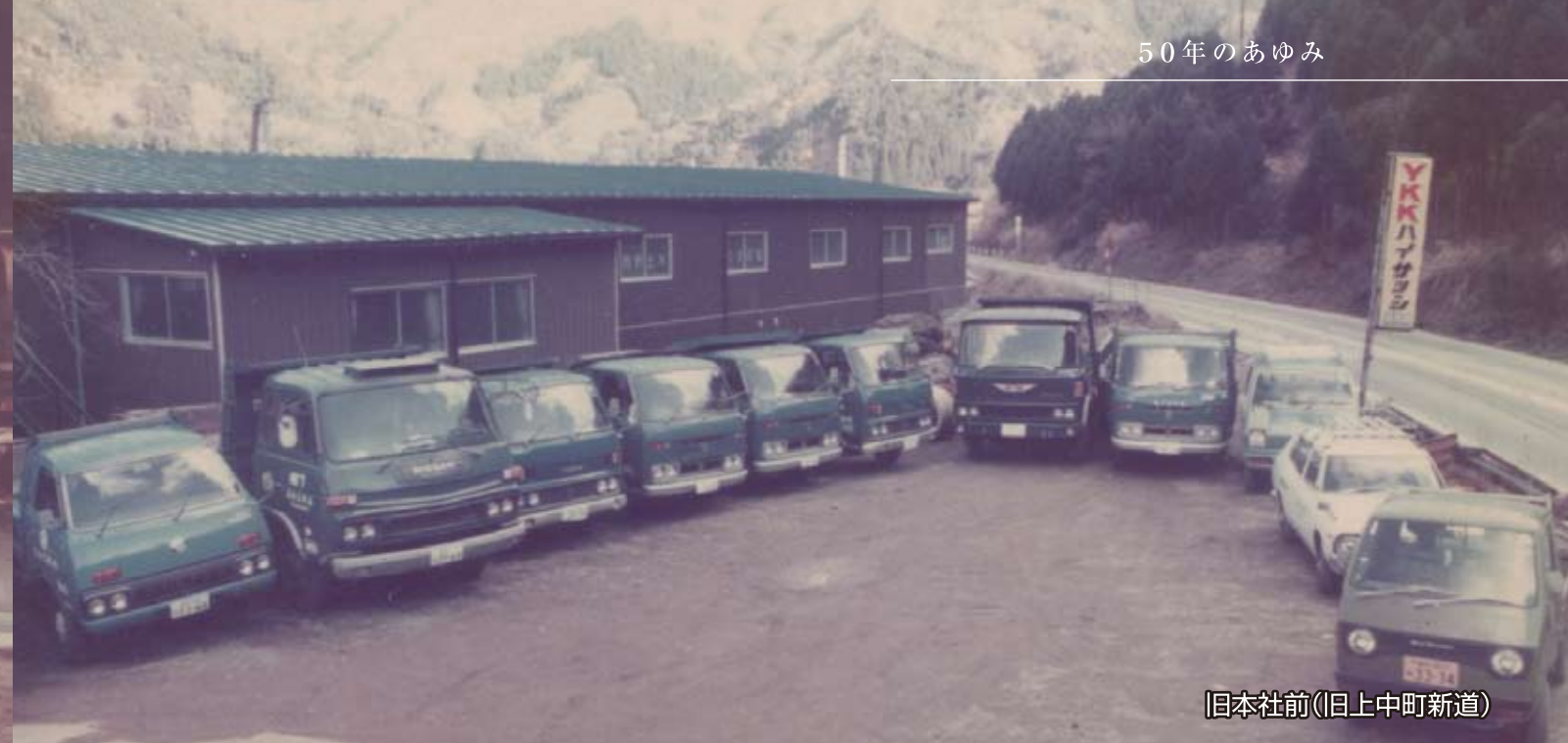
日本社前(旧上中町新道)