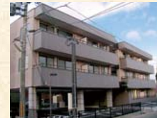
2000(平成12年) モート千種