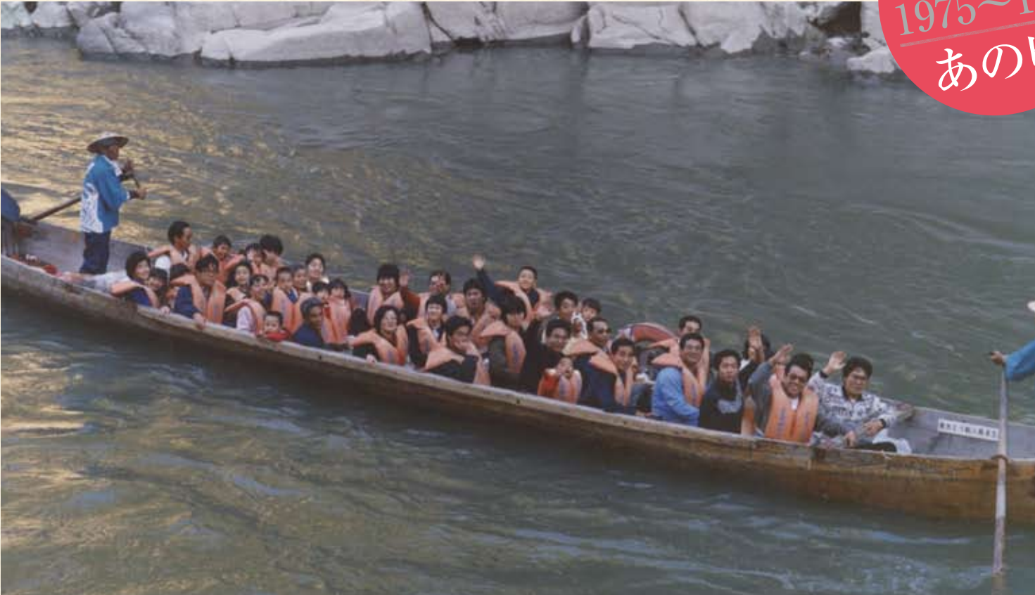
1989(平成元年) 長野県 天竜ライン下り乗舟