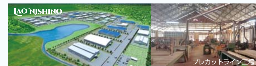
プレカットライン工場

ທີ່ຕັ້ງສຳນັກງານ ເຂດເສດຖະກິດພິເສດ ປາກເຊ ຍີ່ປຸ່ນ ເອີເສເອມອີ 11A, ບ້ານໝາກແງວ, ເມືອງປະທຸມພອນ, ແຂວງຈຳປາສັກ