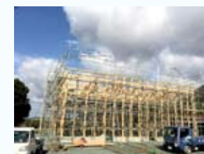
中規模木造トラス建築

中規模木造トラス建築の技術を習得 木工製造・鉄骨工事 企業内転勤 日本の自動車運転免許取得