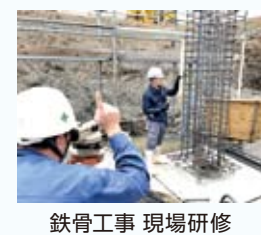
鉄骨工事 現場研修