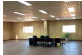
シシクアドクライス様