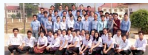
ラオス職業訓練校生