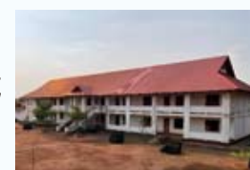
ラオス職業訓練校